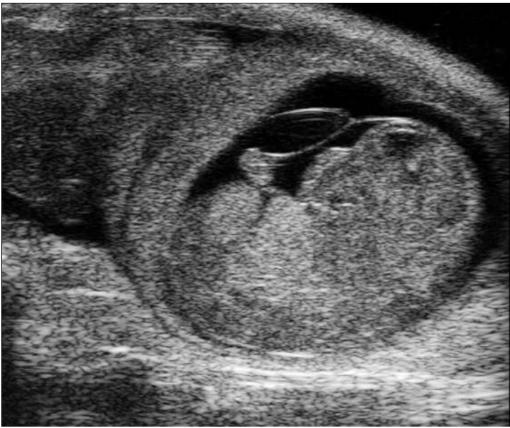
« Zurück Mausembryo am Tag 13 (Bild 9